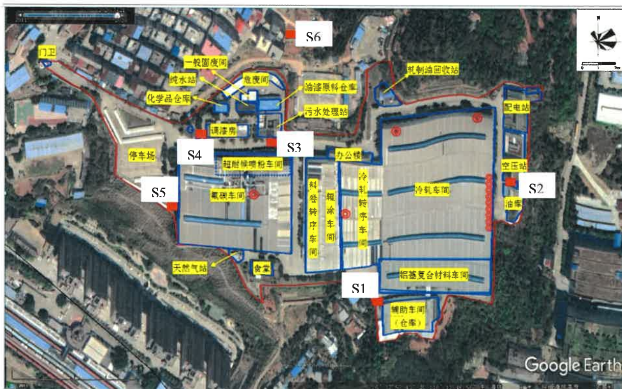
图 4-4 土壤点位示意图